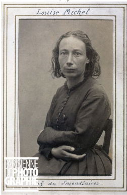
Louise Michel.

Alors victorieux, à même de s'unir et de s'entendre sur leurs intérêts communs, travailleurs et travailleuses, tous solidaires, jouiront en paix des bienfaits de la république sociale. Vive la Commune."